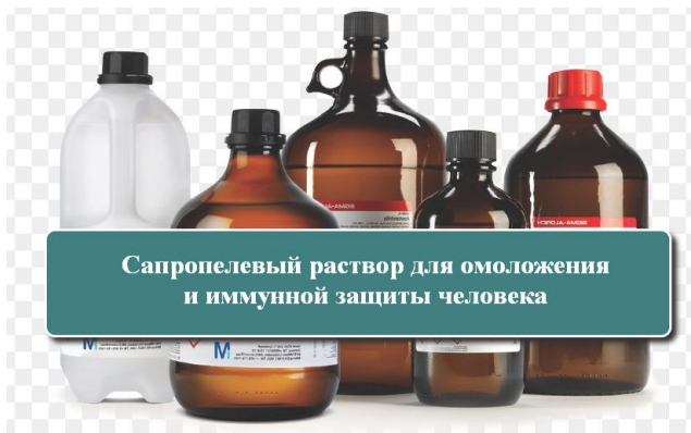
Сапропелевый раствор для омоложения и иммунной защиты человека

Такой раствор с бактериофагами выпускается как природное натуральное средство косметического, профилактического, оздоровительного и омолаживающего характера. Упаковки с продуктом имеют дозированную тару от 20 до 300 мл, герметичные. В зависимости от способа и вида применяемого продукта, продолжительность срока его потребления тоже различна. Так как сапропелевые растворы – натуральные концентрированные препараты от природы, то их передозировка практически исключена. Цикл применения, обычно, от 12 до 24 дней с перерывом на 0,5-1 год. Далее, процесс можно повторить и т.д. Наибольший эффект от применения продукта достигается при его постоянном ежедневном употреблении, например, ополаскиванием полости рта после чистки зубов, протиркой больших частей тела смоченным раствором полотенцем, умыванием лица, рук, шеи, др.