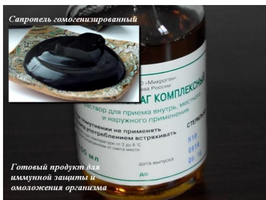
Готовый продукт для иммунной защиты и омоложения организма